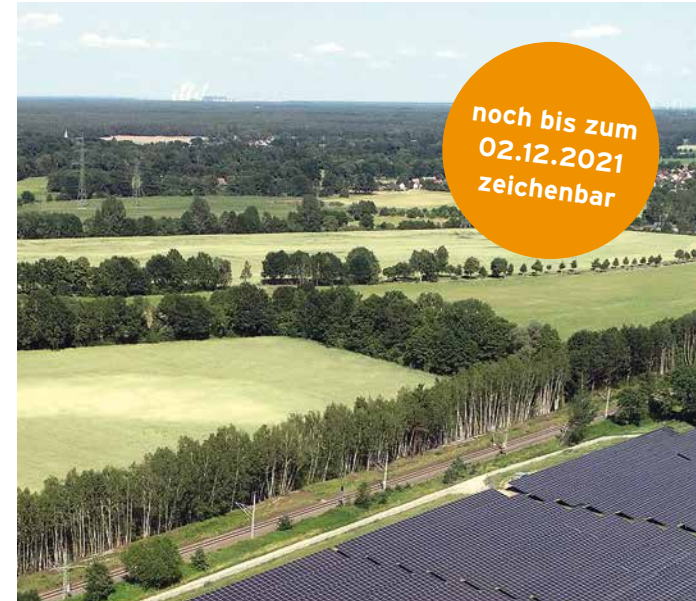
Solarenergie in Deutschland